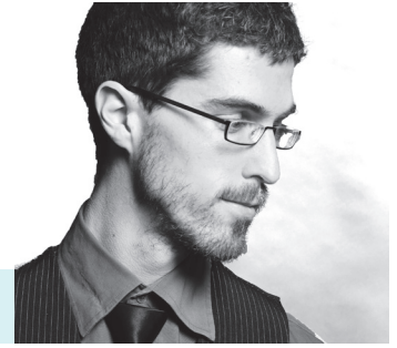
Par Louis Brouillette, Ph. D. en musicologie et conférencier

Entrée libre pour les détenteurs de billet.